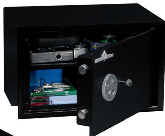
HT 15 1 tablette réglable en hauteur au pas de 40 mm.