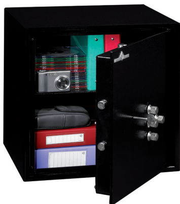
HT 50 1 tablette réglable en hauteur au pas de 40 mm.