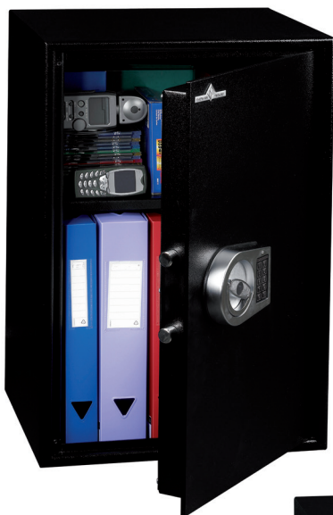
HT 70 1 tablette réglable en hauteur au pas de 40 mm.

Protection anti-effraction norme européenne EN 14450. Classe S1 (uniquement les modèles avec serrure à clé) Blindage anti-perçage au manganèse du système de condamnation.